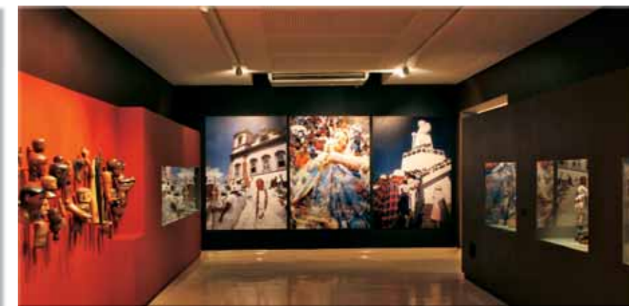
À esquerda: painel recebe luz de sanca no teto, e um gibão de couro, de rasgos laterais. Acima: iluminação proveniente de spots articuláveis e nichos com fibra ótica.