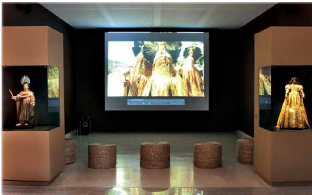
Nível da iluminação geral de 25 lux permite o destaque das obras expostas.