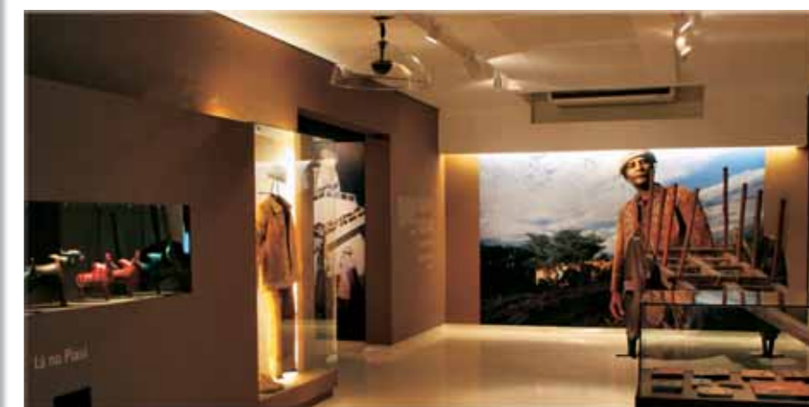
Acima: luz homogênea emitida de sancas destaca fotografia e vestimenta típica. Abaixo, pequenos objetos iluminados por fibras óticas.