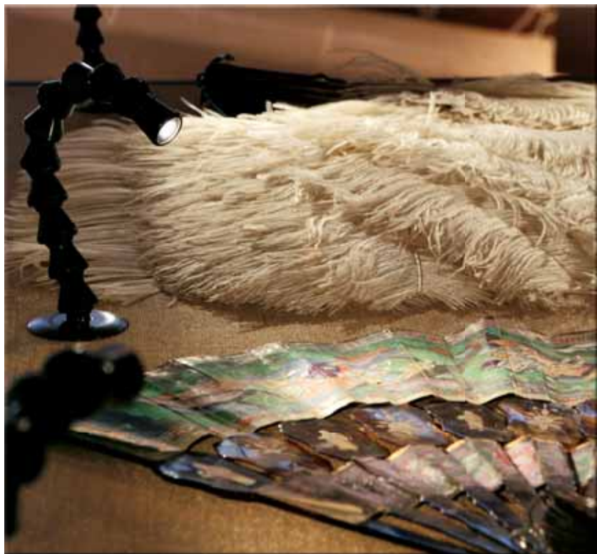
Plumária e objetos sensíveis são iluminados com fibra ótica.