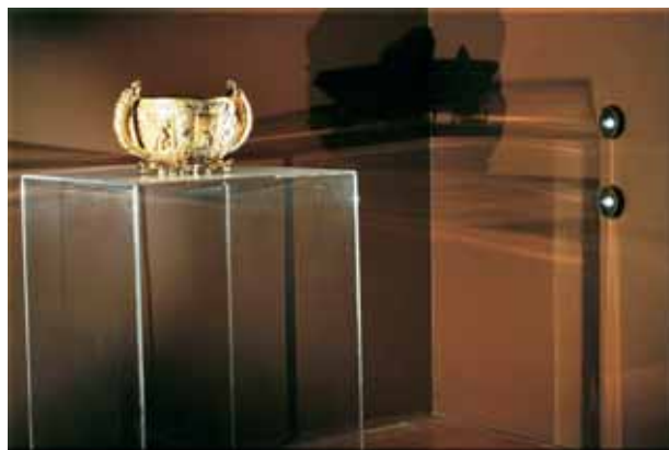
Açucareiro de ouro iluminado lateralmente por fibra ótica.

Para permitir que os objetos em exposição fossem destacados com precisão, o projeto estabeleceu uma luz ambiental tênue, em torno de 25 lux. Esse valor lumínico foi alcançado com o aproveitamento das “sobras”, provenientes da iluminação do acervo, combinadas com a aplicação de películas nas janelas, que atenuam a incidência de luz do Sol.