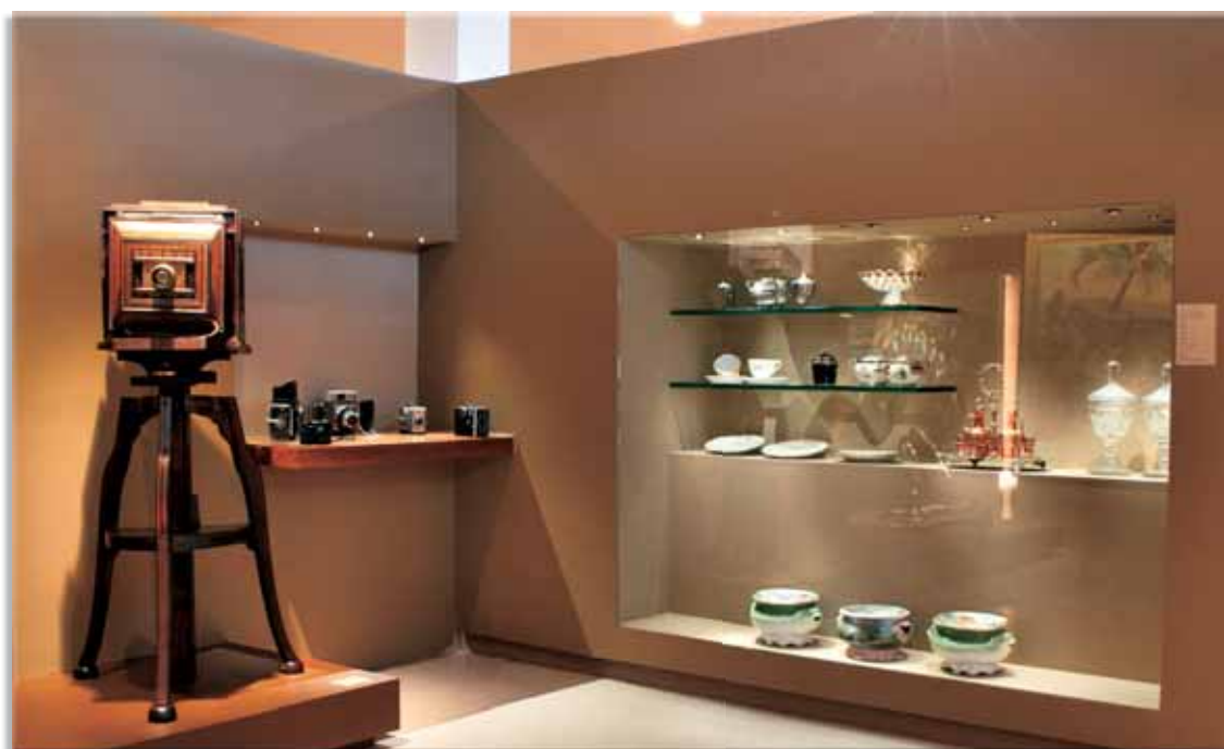
Pequenos objetos iluminados por sistema de fibra ótica.

A fibra ótica também foi utilizada para delinear obras, como fotografias e pinturas.